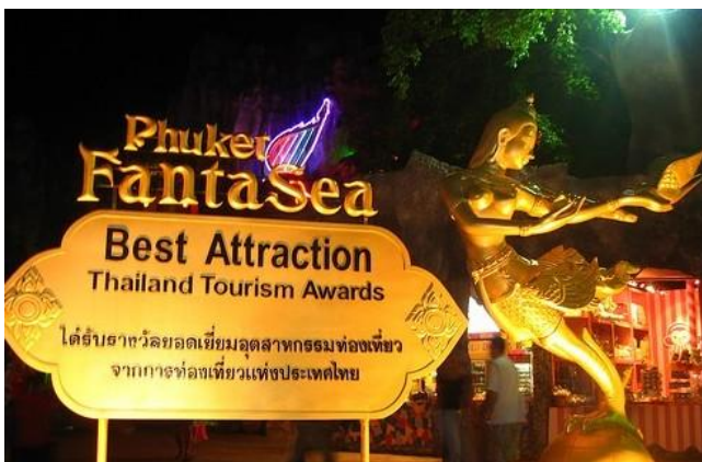
普吉岛幻多奇乐园