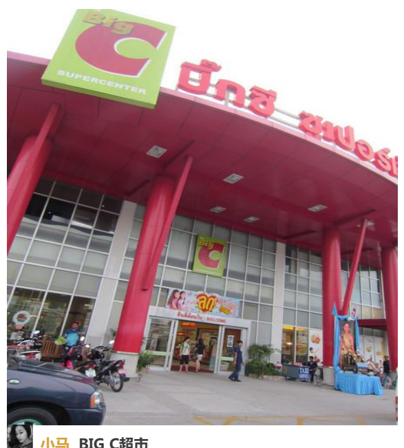
小马 BIG C超市