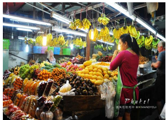
泡沫肥皂 集市卖的热带水果