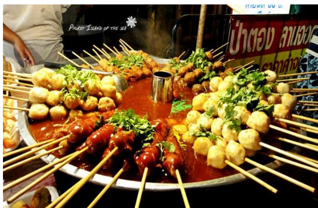
图超 普吉岛的小吃

烧烤海鲜品种不少，像蚝、圆贝、扇贝、虾、青口等等，都可共治一炉。看着肥嘟嘟的蚝肉、贝肉在炉火的热力下，慢慢溢出香喷喷的汁液，再加上“嘶嘶”的烤肉声，食欲马上被刺激起来了。