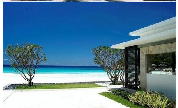
豪华的the racha hotel