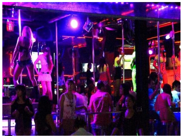
十品芝麻粒 普吉岛的成人秀