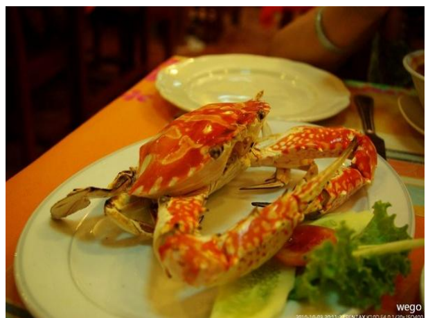
中华哥 普吉岛的海鲜