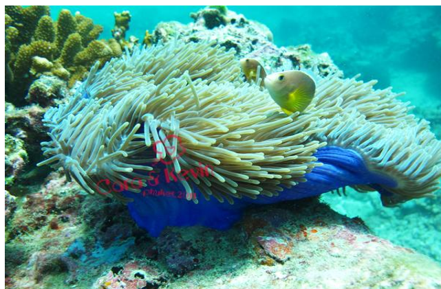
燃小小 在普吉岛潜水